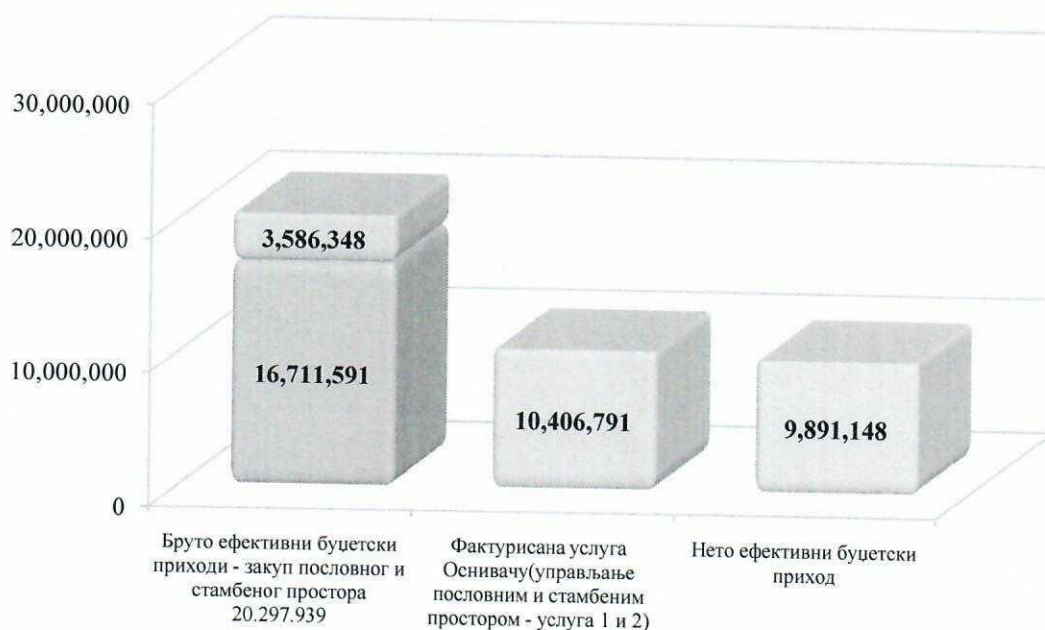
Графикон 1 Веза са буџетом – пословни и стамбени фонд 01.01. – 31.03.2020.

У првом кварталу 2020. године Предузеће је поред фактурисаних услуга Оснивачу, већ поменуте услуге управљања пословним простором (услуга 1) у бруто износу од 6.611.764,32 динара и услуге управљања стамбеним фондом (услуга 2) у бруто износу од 3.795.026,69 динара, фактурисало Граду и услуге управљања спортско-рекреационим центрима (услуга 3) у бруто износу од 843.339,84 динара, као и услугу одржавање Спортско – рекреационих центара (услуга 4) у бруто износу од 666.666,84 динара.