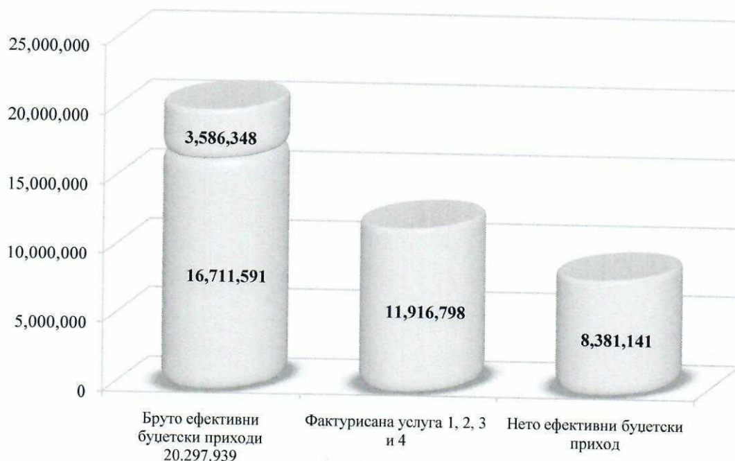
Графикон 2 Веза са буџетом – услуге управљања 01.01. – 31.03.2020.

Графички приказ односа са буџетом, у вези поверених послова управљања непокретностима у власништву града Зрењанина, дат је наредном графикону.