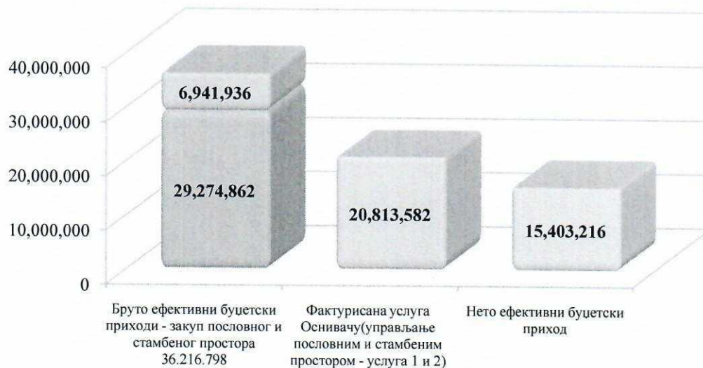
Графикон 1 Веза са буџетом – пословни и стамбени фонд 01.01. – 30.06.2020.

У прва два квартала 2020. године Предузеће је поред фактурисаних услуга Оснивачу, за већ поменуте услуге управљања пословним простором (услуга 1) у бруто износу од 13.223.528 динара и услуге управљања стамбеним фондом (услуга 2) у бруто износу од 7.590.053 динара, фактурисало Граду и услуге управљања спортско-рекреационим центрима (услуга 3) у бруто износу од 3.373.359 динара, као и услугу одржавање Спортско – рекреационих центара (услуга 4) у бруто износу од 3.312.799 динара.